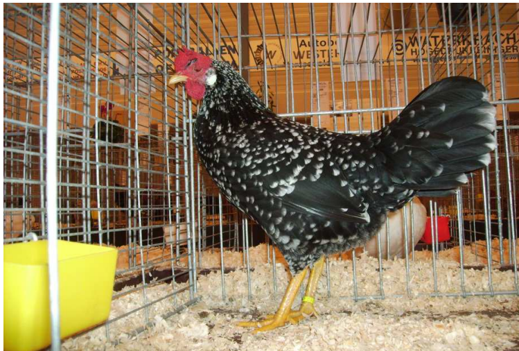
Fokker Ronnie Ketelaar.

Dat dit een show in onze omgeving is die vele fokkers aanspreekt blijkt wel dat er weer 102 dieren meer waren dan in 2010. Ondanks de recessie en de vergrijzing van onze kleindierliefhebbers bestand is deze toename een heuglijk feit. Eén van onze leden, Ronny Ketelaar, is winnaar geworden in de diergroep dwerghoenders met een Ancona kriel enkelkammig zwart/wit gepareld hen jong 1 e U 97 punten.