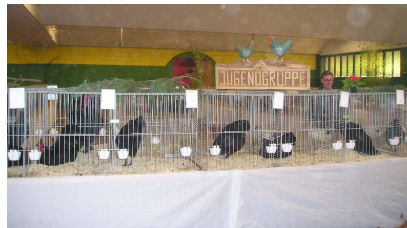
"Fraaie aankleding 5de Euregio-show"

Voor informatie: tel 0315-323966 of www.vleesboerderijdieker.nl