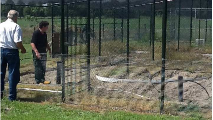
Verblijf in aanbouw voor wadvogels