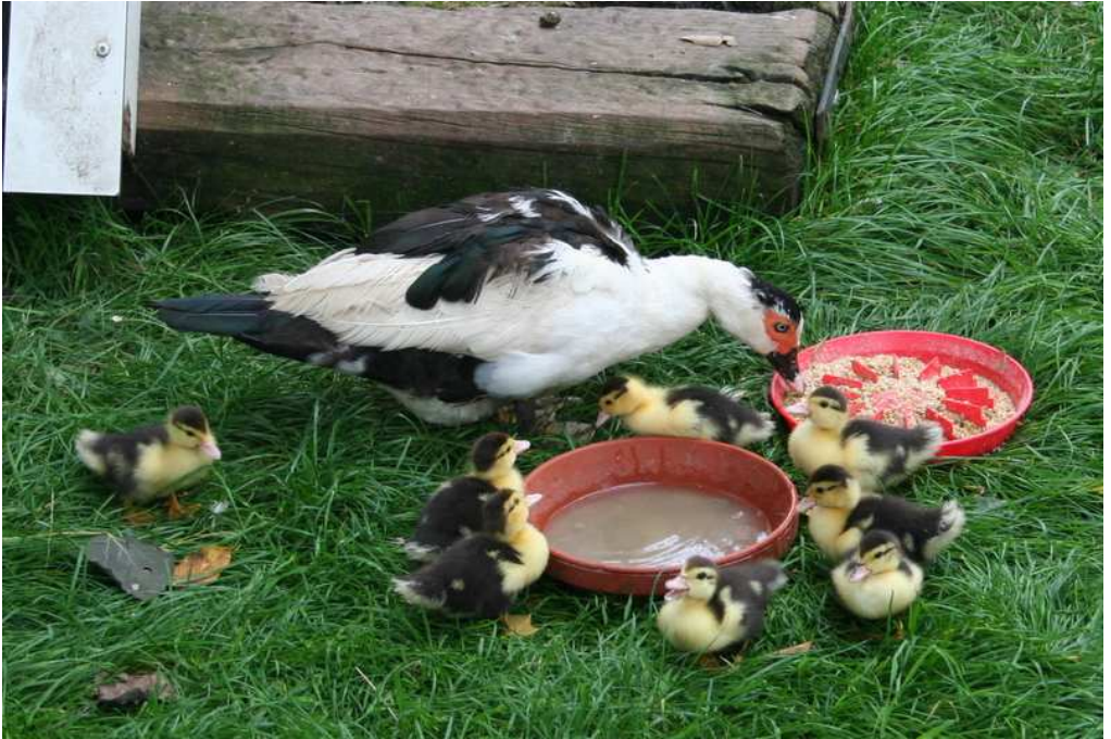
Muskuseend met jongen bij de Schuylhut in Silvolde.

VERENIGINGSBLAD VAN K.P.V. SILVOLDE EN OMSTREKEN www.kpvsilvolde.nl okt. 2013, NR 24