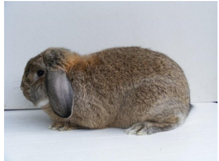
Duitse hangoor, konijngrijs