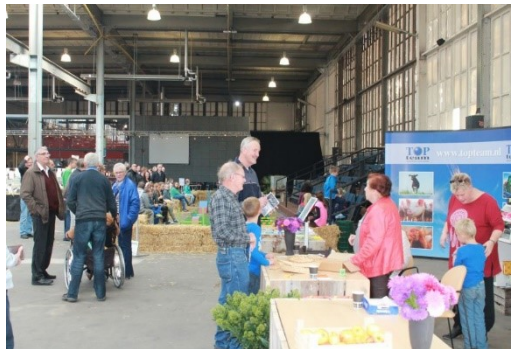
Jongedierendag in de SSP-HAL