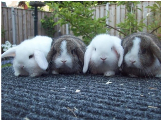
Vier Nederlandse hangoordwergen

Registratiebewijzen zijn eveneens bij mij te verkrijgen.